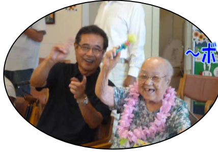
～ボランティア～ ハーモニ